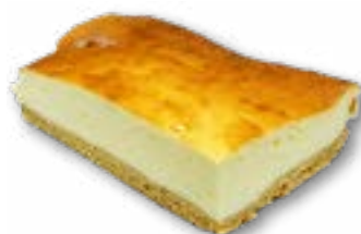
Sernik wiedeński delikatny, wilgotny sernik na kruchym spodzie