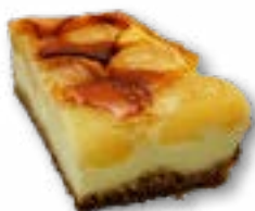
Sernik gruszka delikatny sernik na kruchym cięście z zapieczonymi na wierzchu gruszkami