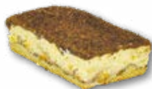
Sernik mieszany delikatny sernik z kawałkami brzoskwiń na kruchym cieście