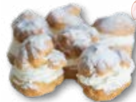
Mini ptysie z bitą śmietaną