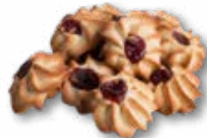
Słoneczka z marmoladą