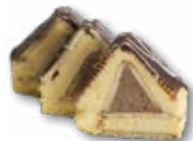
Chatka Puchatka masa serowa z herbatnikami