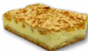
Sernik z bezą delikatny sernik na kruchym spodzie z kawałkami brzoskwiń i zapieczoną bezą na górze