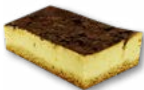
Sernik z czekoladą delikatny sernik na kruchym cięście polany warstwą czekolady