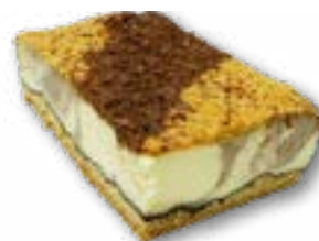
Sernik duet delikatny sernik śmietankowo kakaowy na kruchym spodzie