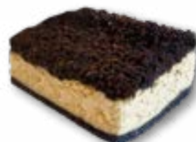
Sernik Karmelowy delikatna puszysta masa jogurtowa o smaku karmelowym na cienkim czekoladowym spodzie