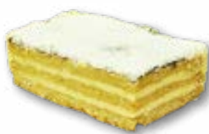
Sernik gotowany kruche zapiekanki przełożone gotowaną masą serową zapieczonymi w bezie