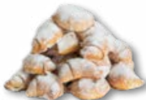
Rogaliki z serem lub z marmoladą