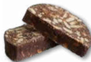
Blok czekoladowy masa czekoladowa z herbatnikami