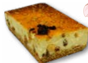
Sernik z rodzynką delikatny sernik na kruchym cieście z dodatkiem rodzynek