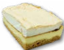
Sernik rosa sernik na kruchym cieście z delikatną bezą na wierzchu