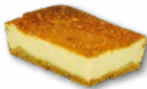
Sernik czysty pyszny domowy sernik na kruchym cięście