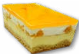
Sernik mandarynka delikatny sernik na kruchym spodzie z mandarynkami w bitej śmietanie polany galaretką