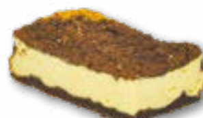
Sernik mambo delikatny sernik na kakaowym spodzie, posypyany ciemną kruszonką