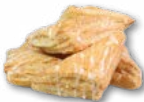
Rożki francuskie z jabłkiem oblane lukrem