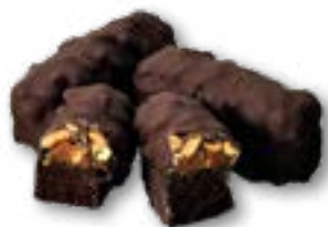
Baton z orzechami i słonym karmelem