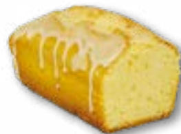
Babka piaskowa ciasto piaskowe polane lukrem