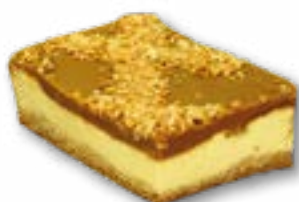
Sernik krówka delikatny sernik na kruchym spodzie, przykryty masą krówkową i orzeszkami