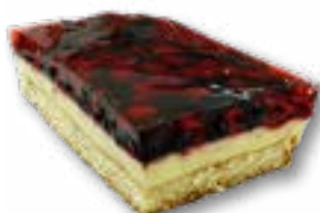
Sernik na zimno jasny biszkopt przełożony serkiem waniliowym z dodatkiem owoców polany galaretką