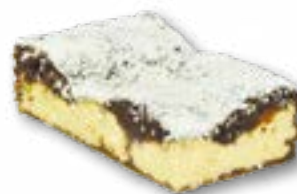
Sernik Izaura pyszny sernik z ciemnym ciastem i delikatną masą serową