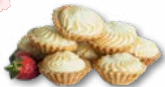
Babeczki z serem i musem porzeczkowym