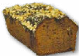
Korzenne aromatyczne, wilgotne ciasto z dodatkiem rodzynek i orzechów włoskich