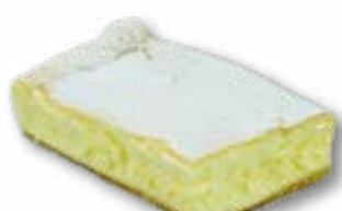
Sernik lekki delikatna, puszysta masa jogurtowa o smaku śmietankowym na cienkim, kruchym spodzie