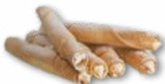
Rurka z toffi i bitą śmietaną