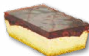
Sernik z wiśnią sernik na kruchym cieście z wiśniami w żelu na wierzchu