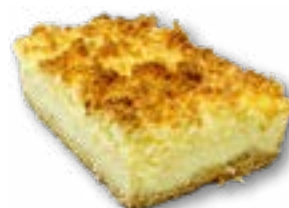
Sernik z kokosem delikatny sernik na kruchym spodzie przykryty kruszonką z wiórek kokosowych