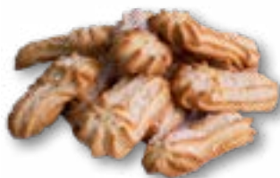
Ciasteczka maślane z cukrem