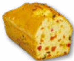
Keks jasne ciasto całe zatopione bakaliami