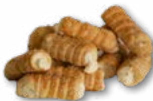
Rurka francuska z kremem