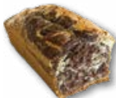
Babka marmurkowa ciasto piaskowe posypane cukrem