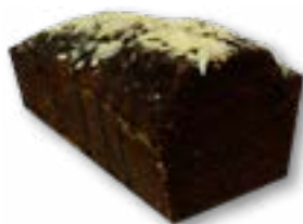
Murzynek aromatyczne, wilgotne ciasto kakaowe polane polewą czekoladową z dodatkiem migdałów